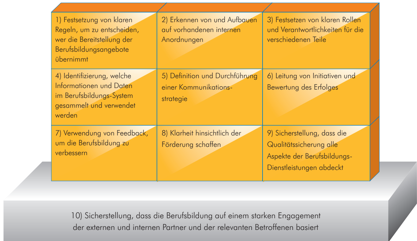
Abbildung 2: Die zehn Bausteine

Jeder Baustein bezieht sich auf den Qualitätssicherungs-Zyklus, umfasst einen „Handlungsauftrag“ und stellt die Aktivität dar, die dabei hilft, ein Qualitätssicherungssystem für berufliche Bildung in Übereinstimmung mit der EQARF-Empfehlung zu entwickeln.